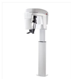
CT・パノラマ KR-8200 3D