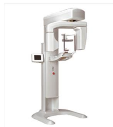
CT・パノラマ KR-X SCAN