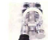
ダクトコネクター