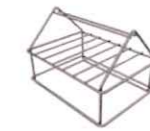
ブライヤーラック