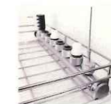
内腔洗淨用ダクト