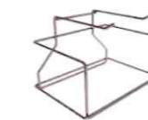
印象トレーラック