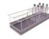
パーティカルラック